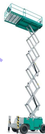
IT 12180 DE