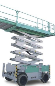
IT 17220 D