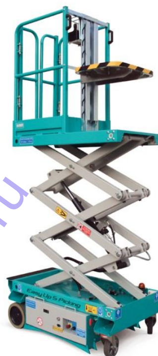
EASY UP 5 PICKING