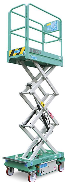
EASY UP 5