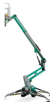
IM R 19