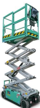
IM 5980 MC