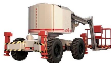
Parma 21 D