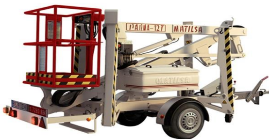
Parma 12 T