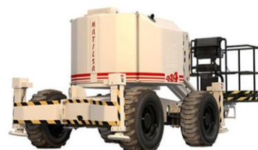
Parma 16 D