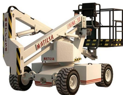
Parma 13 DE