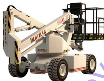
Parma 13 E