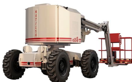
Parma 18 D