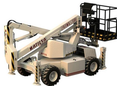
Parma 13 D