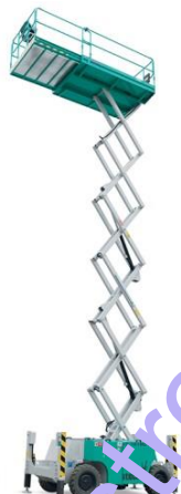
IT 12180 D