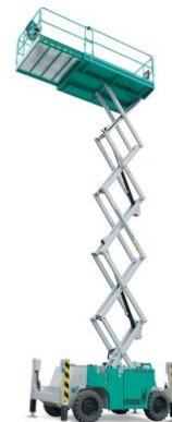
IT 10180 D