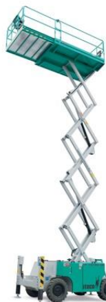
IT 10180 DE