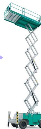
IT 12180 DE