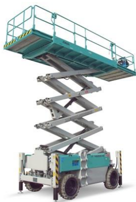
IT 14220 E