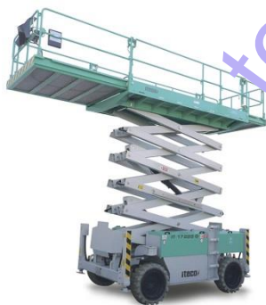
IT 17220 D