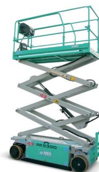
IM 6390 EX