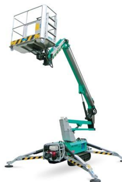
IM R 15