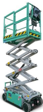
IM 5980 MC