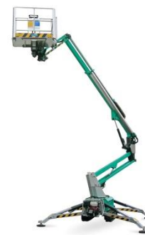
IM R 19 D