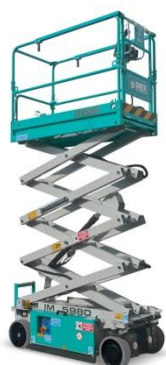
IM 5980 EX