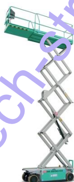
IM 8290 EX