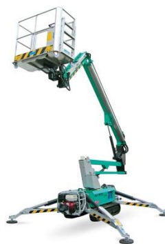
IM R 15 D