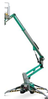
IM R 19