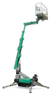
IM R 13