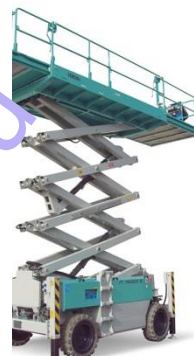
IT 14220 D