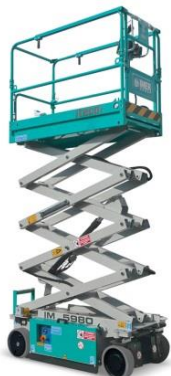
IM 5980 EX