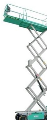
IM 8290 EX