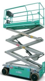
IM 6390 EX