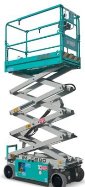
IM 5980 EX