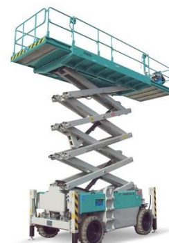
IT 14220 E