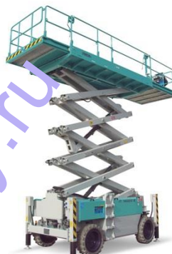
IT 14220 D