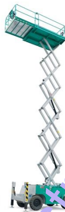
IT 12180 DE