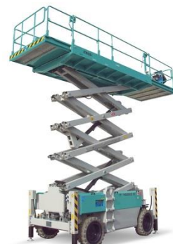
IT 14220 E