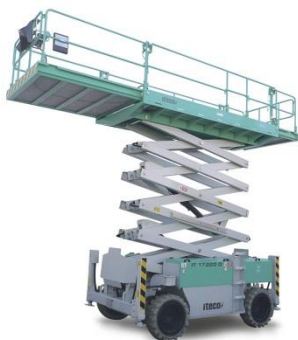
IT 17220 D