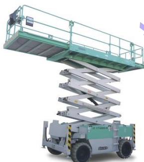
IT 17220 E