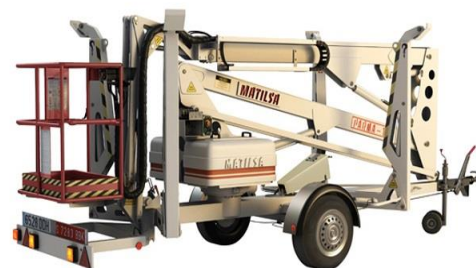
Parma 15 T