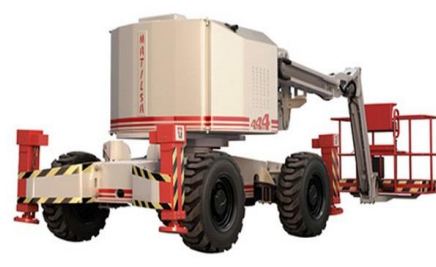
Parma 21 D