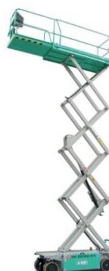
IM 8290 EX