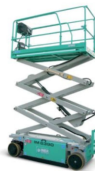
IM 6390 EX